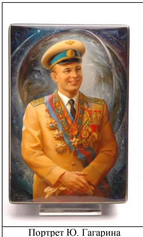
Портрет Ю. Гагарина

9. Перечислите техники федоскинской лаковой миниатюрной живописи, в которых выполнен данный портрет