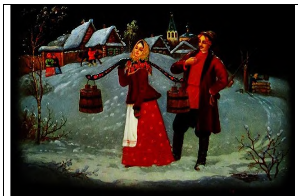
«Вдоль по улице»

15. Назовите автора федоскинской лаковой миниатюрной живописи «Вдоль по улице»